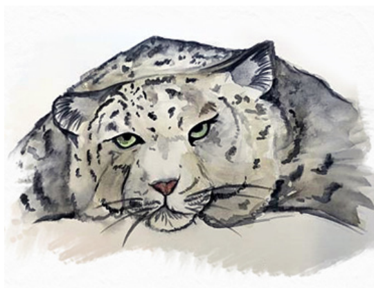
Exercices réalisés en s'inspirant d'œuvres artistiques connues