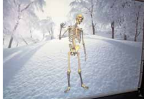
Danse, le squelette vous suit !