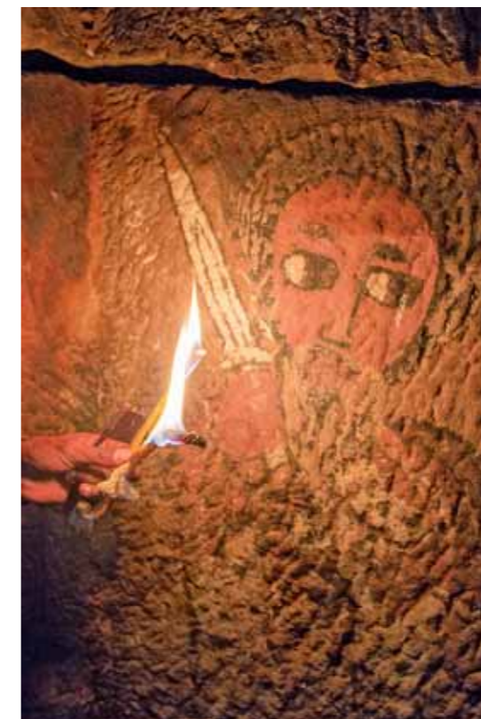
La parole de Dieu est vivante et efficace, plus tranchante qu'une épée à deux tranchants, Heb 4:12 fresque éthiopienne.