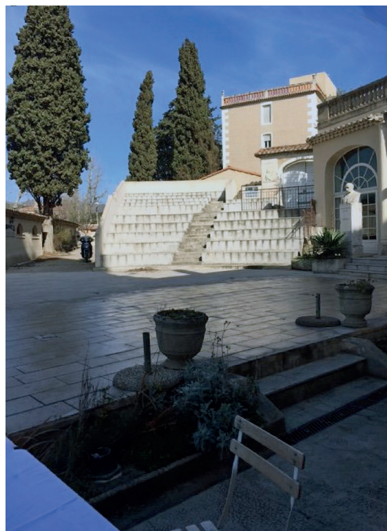
Le Musée Provençal de Château Gombert.

Après ces 2 années difficiles, nous ferons de cet événement le fer de lance de la communication de VSart Aix-Marseille auprès de la presse locale qui sera conviée.