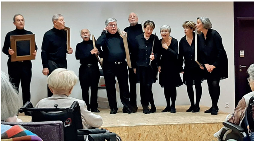
“Les Bouffes Lyonnais”.

“Les résidents font ainsi preuve d'imagination en exprimant leur fibre artistique tout en se réchauffant le cœur !”