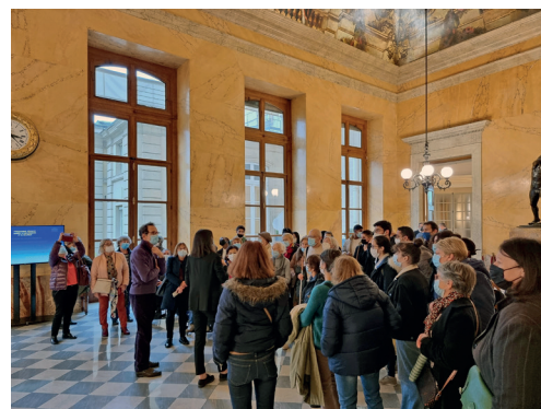
Visite à l'Assemblée Nationale.