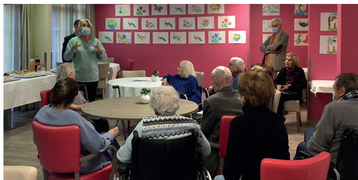
Exposition de l'atelier peinture à Ornano.