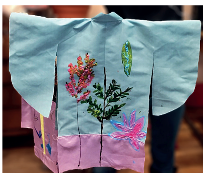
Atelier de l'Ecole Fessart (Paris 19ème) - Kimono réalisé sur tissu à la peinture et une figure de princesse en peinture à la gouache.