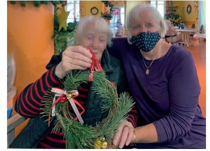
Ateliers « couronnes de l'Avent » à Grenoble.

“Les résidents font ainsi preuve d'imagination en exprimant leur fibre artistique tout en se réchauffant le cœur !”