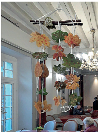
Atelier feuilles mortes à Compiègne.