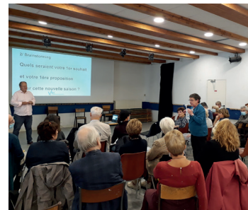
Réunion de travail du 30/09 - acte 2.