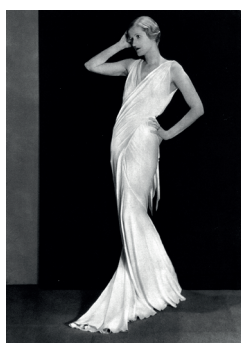
Man Ray 1934.

Avec un voyageur amoureux du Sud-Est asiatique, les résidents visitent la Corée du Sud et la Thaïlande. Un admirateur d'Hergé et de Tintin raconte une course au trésor de La Licorne à Rackham Le Rouge. Enfin, une professeure d'anglais parlera de la vie quotidienne en Grande Bretagne pendant la deuxième guerre mondiale.