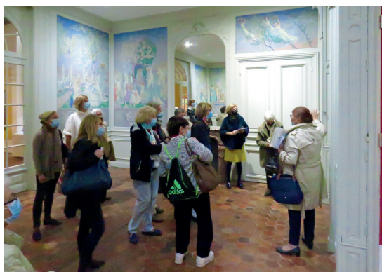
Visite du Prieuré à Saint-Germain en Laye.

Au programme : visite du Prieuré à Saint Germain en Laye avec la découverte de l'artiste Maurice Denis, ses peintures et ses vitraux et après le déjeuner une balade à Versailles du Petit Trianon au Hameau de la Reine, dans le parc anglais « égayé » par les sculptures animalières des Lalanne. Une nouvelle fois, la convivialité était au rendez-vous et quelle joie de se retrouver pour de vrai ! Un beau moment de vie associative.