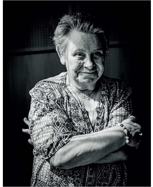
Atelier « photo-portraits » à la résidence Bévière à Grenoble.

“Quelle joie d'avoir pu rencontrer les résidents en faisant leur portrait”