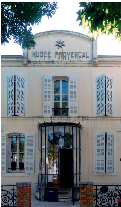
Futur bureau VSArt Marseille au « Musée des Arts et Traditions Populaires du Terroir Marseillais » à Château-Gombert.

Une réception amicale clôturait l'AG de VSArt Lyon, réception à laquelle avaient été conviés quelques institutionnels lyonnais.