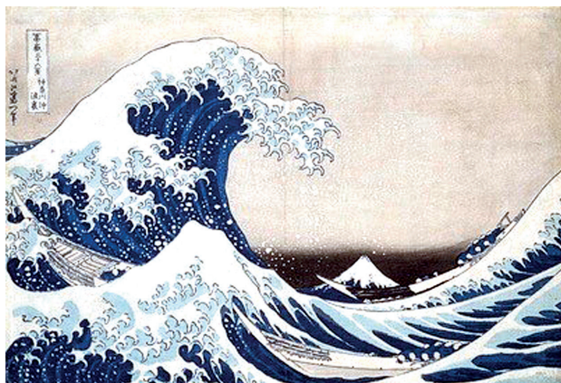
Hokusai, la vague.

L'année scolaire 2020-2021 s'est encore achevée en juin sans que nous ayons pu faire notre exposition annuelle sur le thème « L'eau dans tous ses états ». Cependant, de nombreuses œuvres avaient été réalisées dans les centres de loisirs, qui, pour la plupart, ont continué de fonctionner les mercredis après-midi malgré les aléas et les difficultés liés à l'épidémie de Covid. Nous avons donc encouragé les bénévoles à exposer les