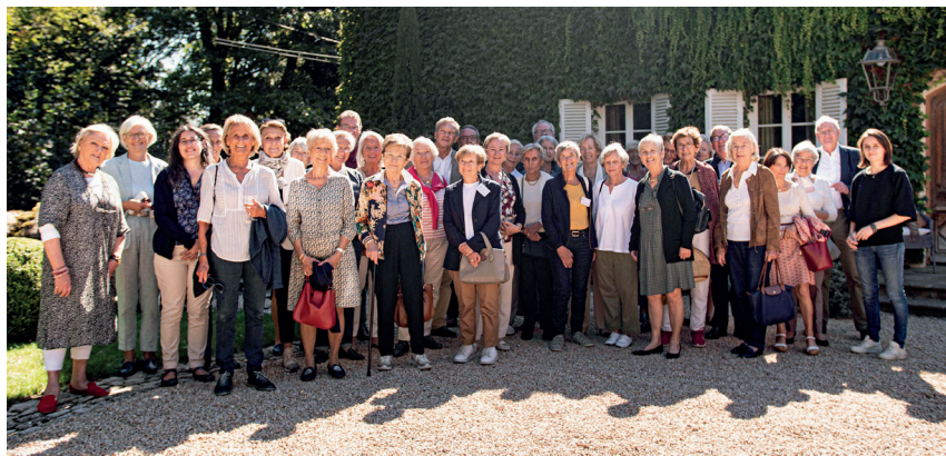
Les bénévoles de VSArt Lyon lors de l'AG du 30 septembre 2021.

Le 30 septembre 2021 les bénévoles de VSArt Lyon se sont réunis en Assemblée Générale et, à cette occasion, a été dressé un bilan de la dernière saison 2020-2021. Bien que particulièrement chahutée depuis mars 2020, l'action de VSArt Lyon a néanmoins enregistré une très bonne reprise depuis janvier 2021 avec quelque 106 concerts et conférences (par rapport à 132 programmés initialement). Bilan positif également avec désormais 18 établissements fidélisés c'est-à-dire qui, pour la plupart, bénéficient d'une animation culturelle par mois. La priorité est désormais axée sur le recrutement de bénévoles accompagnants dédiés aux établissements.